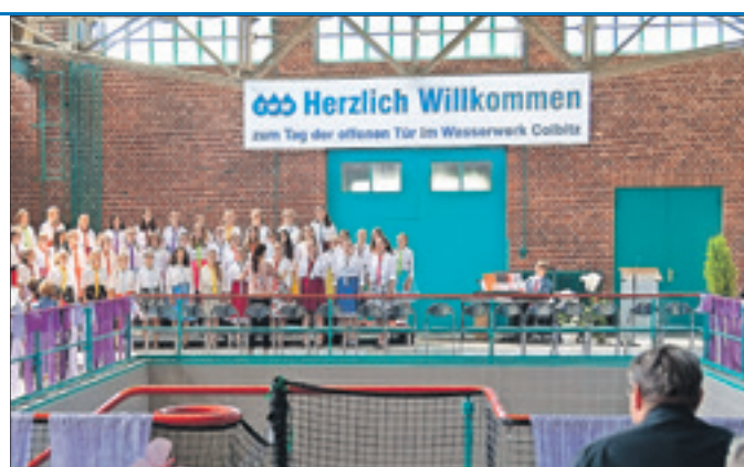
Ein Chorkonzert wird den Besuchertag im Colbitzer Wasserwerk eröffnen.